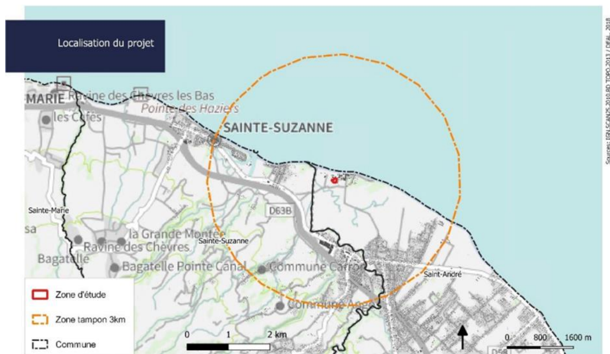
Figure 4 : Communes susceptibles d'être affectées par le projet

Ces communes correspondent au rayon d'affichage de la nomenclature ICPE (3 km). Par leur nature, les effets du projet ne sont pas susceptibles de s'étendre au-delà de ce périmètre.