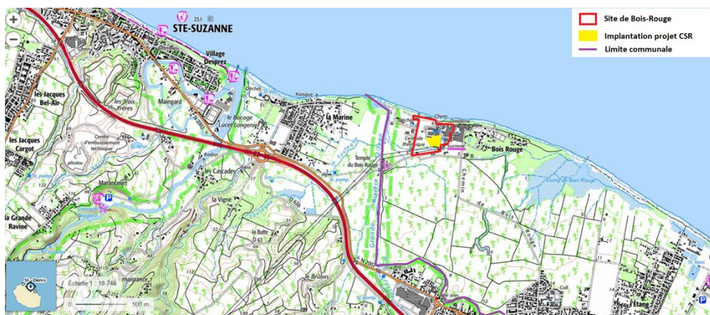
Figure 1 : Situation du projet CSR

Le site est accessible par le chemin Bois-Rouge depuis la N2.